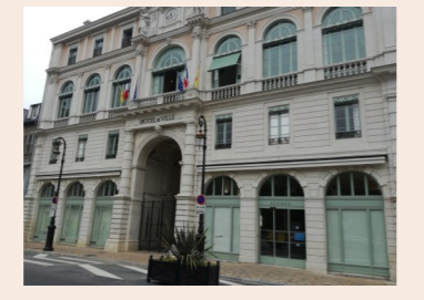
Hôtel de Ville & Communauté d'Agglomération de Pau