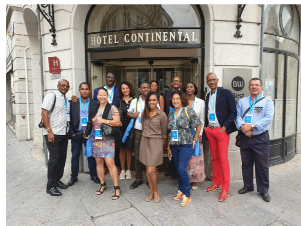
La délégation des Outre-mer avec la Guadeloupe, la Martinique, la Guyane.