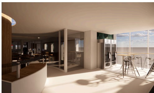
MODELISATION ESPACE ACCUEIL