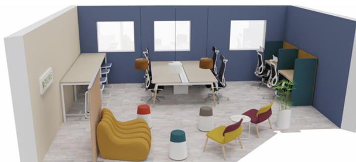
MODELISATION DE L'ESPACE DE COWORKING