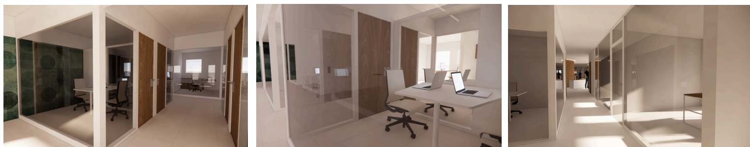
MODELISATION DES ESPACES DE BUREAUX

Un dépôt de garantie équivalent à 2/12 du loyer annuel de la première année conditionnera la remise des clés.