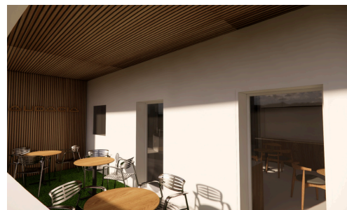
MODELISATION ESPACE EXTERIEUR