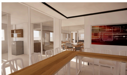
MODELISATION SALLE DE REUNION

✗ Sont exclues les associations loi 1901 même celles bénéficiant de l'agrément ESUS