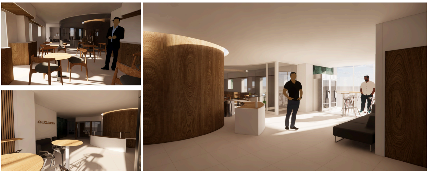
MODELISATION DE L'ACCUEIL ET DE L'ESPACE DE CAFETERIA

Ce Comité statuera en phase finale de sélection pour proposer des lauréats pour installation à la Pépinière d'entreprises CAP ENTREPRENDRE.